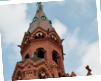
PASSIONSKIRCHE Marheinekeplatz 1, 10961 Berlin