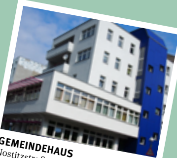
GEMEINDEHAUS Nostitzstraße 6/7, 10961 Berlin