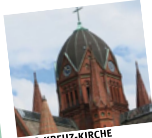
HEILIG-KREUZ-KIRCHE Zossener Str. 65, 10961 Berlin