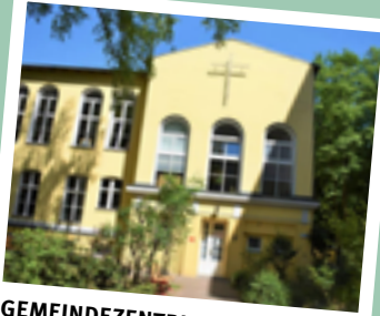
GEMEINDEZENTRUM Wartenburgstr. 7, 10963 Berlin